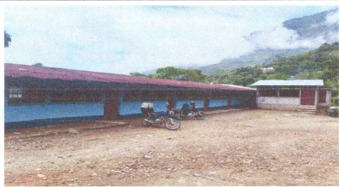
Foto1: Cambio y reparación de Techo.